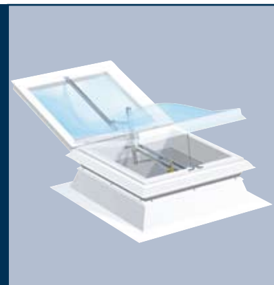
Wieniec renowacyjny ESSMANN, wys. 15 cm

Wieniec renowacyjny ESSMANN o wys. 15 cm, wykonany z ramy z tworzywa sztucznego, ocieplony. Wieniec renowacyjny osadza się na wieńcu istniejącym, następnie prowadzi się pokrycie dachowe na górną